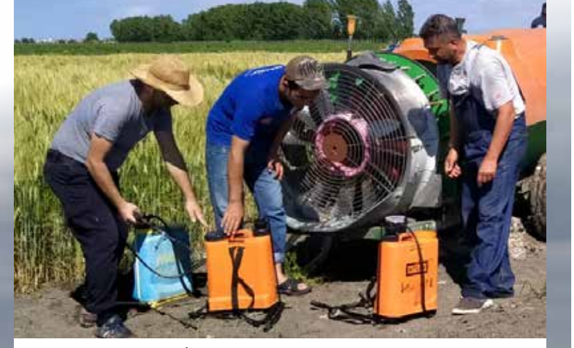
Adana Açık Ceza İnfaz Kurumu personeli, bu hassas dönemde özverili, gayretli ve fedakarca çalışmaları ile üzerine düşeni fazlasıyla yaparak görevlerini ifa ediyor.